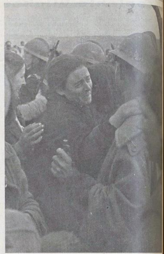
En la toma del Santuario esta mujer abraza emocionada a un soldado. Pasano suyo que le da noticias de su hijo, también soldado del ejército