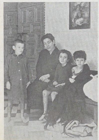
En la tristeza de estas caras están reflejados todos los padecimientos sufridos por los cautivos del Santuario de la Cabeza

Darse cuenta los hombres populares de la provincia de Córdoba y Jaén de la traición de la guardia civil de Sierra Morena, lanzar un grito de indignación, de nobleza en la Sierra, y salir de sus hogares contra ellos todo fue uno. La guerra andaba perdida por toda España,