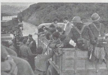
Los franquistas dan comida a los niños a poco de ser rescatados de los horrores del Santuario

Nuestros frentes de Andalucía se han mantenido casi indefensos hasta los dos meses. Ni un tanque, ni un aeroplano, pocos hombres y pocas fusiles durante ochos meses de guerra cruda. La aviación fascista ha operado a placer contra los andaluces, se ha cebado en ellos por mandato del general de las botas. Andujar ha sido acometida por las bombas italianas y alemanas infinidad de veces. Los escasos hombres que formamos frente a los rebeldes del Lugar Nuevo y el Santuario eran víctimas constantes de la aviación. Sin guardias, a campo descubierto, han visto transcurrir el invierno en las trincheras y han recibido en su cuerpo las lluvias y los vientos inelentes de Sierra Morena. Sin ninguna preparación militar recibidos contra hombres curtidos en el tiro y en la disciplina férrea con desventajas de ferros y de armas, dominados por las ametralladoras y las miradas de la banda de Cortés, empalizadas en las alturas de Cerro Chico y el Santuario.